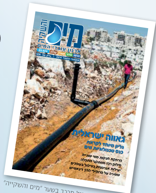
פקסגול מכבב בשער "מים והשקיה"

נהנה ממהירות ויעילות פריסה והתקנה של קטעי פקסגול ארוכים במיוחד. מספר דוגמאות: צינור 110 מ"מ השווה ל-4 צול, מסופק ביחידה אחת רציפה של 900 מטר. צינור 160 מ"מ השווה ל-6 צול מסופק ביחידה אחת באורך 500 מטר וצינור בקוטר 225 מ"מ השווה ל-8 צול מגיע מהמפעל לשטח בקטע רציף של