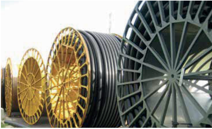
פקסגול בקטעים ארוכים