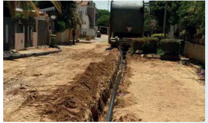
פקסגול משתלב בתשתיות קיימות