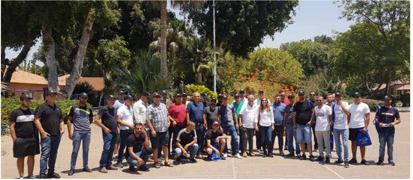
קבלני אינסטלציה והצוותים המקצועיים שלהם ביום השתלמות במפעל גולן, בנוסף להדרכה על מערכות האינסטלציה והשפכים הדירתיים של גולן, נערך גם סיור במפעל היה אש.