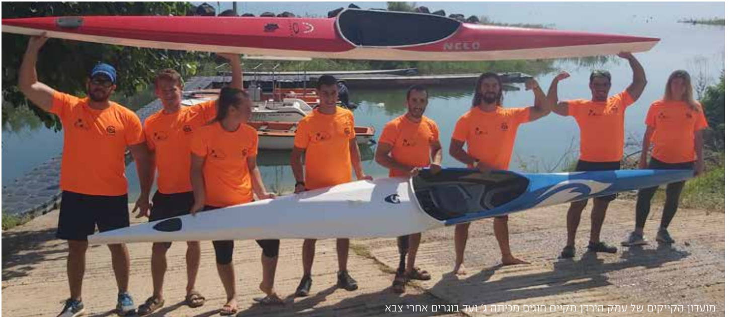
מועדון הקייקים של עמק הירדן מקיים חוגים מכיתה ג' ועד בוגרים אחרי צבא