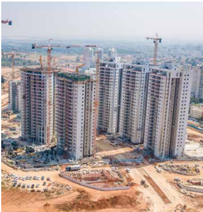
נווה דורון החדשה - תמונת רחפן

יחד עם הגידול בתחום המגורים נכנסה החברה בשנים האחרונות לתחום מסחר, משרדים ודירור להשכרה והכל כפרויקטים מניבים בניהם מבנה משרדים של מעל 50,000 מ"ר במתחם ה 1000.