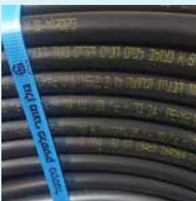
מפרט הטכני לאורך הצינור