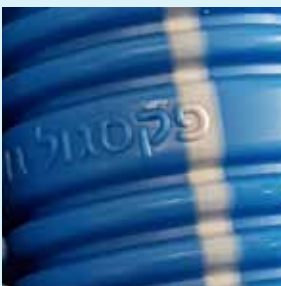
צינור מתעל מקורי עם פס לאורכו