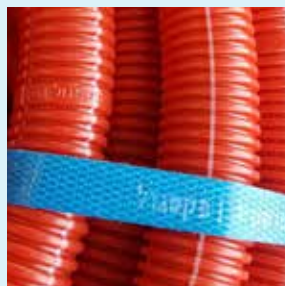
הטבעת לוגו גולן על הצינור