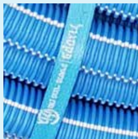
פס בצבע טורקיז לאורך הצינור